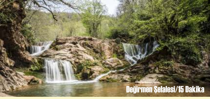
Değirmen Şelalesi/15 Dakika