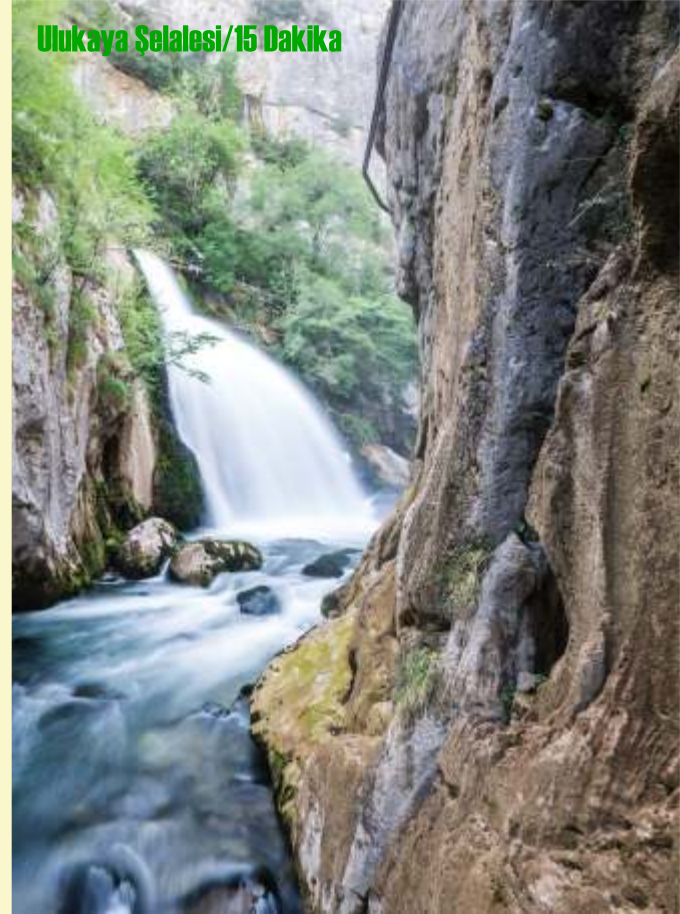
Ulukaya Şelalesi/15 Dakika